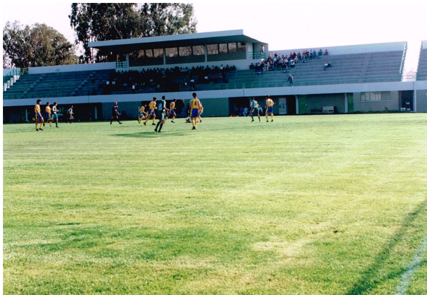
Το γήπεδο «Κατωκοπιά» στην Περιστέρωνα

ώστε αυτό να μπορεί να φιλοξενεί αγώνες Α΄ Κατηγορίας. Με τις άοκνες προσπάθειές του το γήπεδο ανακατασκευάστηκε την περίοδο 1999-2000.