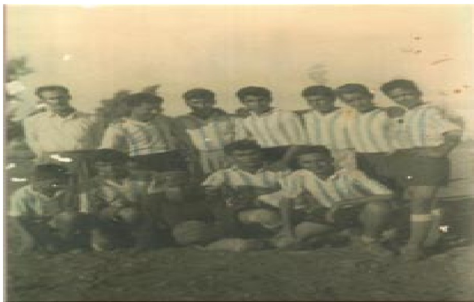
Ιστορική φωτογραφία με τους πρώτους ποδοσφαιριστές της ΔΟΞΑΣ

Τα επιτεύγματα και στους τρεις πιο πάνω αναφερόμενους πυλώνες υπήρξαν αξιόλογα. Θαυμασμό, όμως, και περηφάνια προκαλεί σε όλους η δραστηριοποίηση του Σωματείου στα αθλητικά δρώμενα του τόπου. Η σύσταση και λειτουργία της ποδοσφαιρικής ομάδας και η πορεία που αυτή ακολούθησε οδήγησαν, ουσιαστικά, στην ταύτιση της Κατωκοπιάς με τη ΔΟΞΑ.