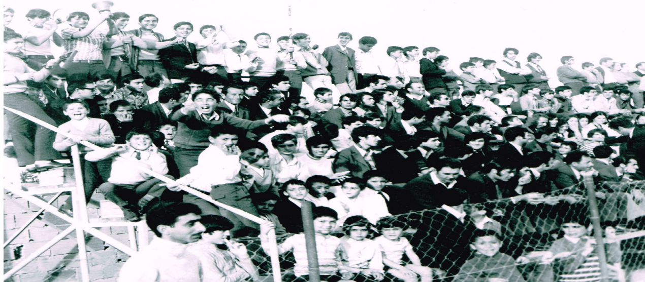
Φωτογραφία της κερκίδας της ΔΟΞΑΣ στην Κατωκοπιά κατάμεστη από φιλάθλους